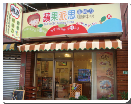
◀ 蘋果派思訓練中心

第四天：蘋果派思訓練中心 Tel. (03) 2206665 ; (03) 2288646